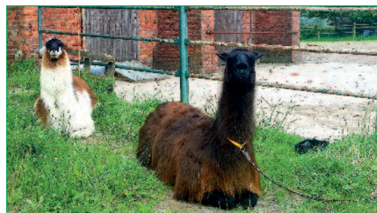
Lancelot (l.) und Rocky haben es sich auf dem Hof von Petra Müller-Koop in Panten gemütlich gemacht.

Infos Günter Schewe, Tel. 0 45 44 / 5 45 pg