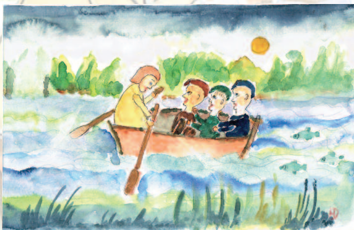
„Mudder Brandt“ setzte die Arbeiter im Ruderboot über die Stecknitz. Das Bild zu ihrer Geschichte malte Helga Dresow für die Stecknitz-Post.

Heute weiß vermutlich kein Göldenitzer mehr, was sich vor fast 150 Jahren an der Stecknitz abspielte. Man kann aber immer noch Ziegelsteine von der Kate am alten Uferweg finden.