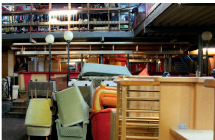
Kleidung, Haushaltsgegenstände und sogar Möbel werden im Sozialladen angeboten.

zialladen und die Fahrradwerkstatt wurden feierlich eröffnet. Einmal im Monat können nun Spenden abgegeben werden, und Migranten sowie andere bedürftige Personen können für kleines Geld Kleidung und Haushaltsgegenstände kaufen. Wird Hilfe gebraucht, steht immer ein großer Helferkreis unterschiedlicher Nationalitäten zur Verfügung.