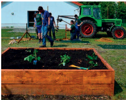
Auf das Bepflanzen des neuen Hochbeets freuen sich die Kinder ebenso wie über die Spielgeräte.