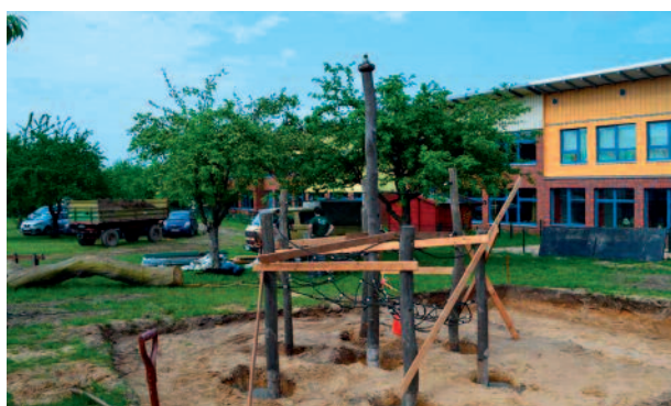
Das Klettergerüst, das bisher am Pastorat stand, wurde beim Kindergarten Moorhof aufgebaut.

der Wunsch nach einer Einzäunung des neuen Areals: 25 Meter Zaunelemente mussten zunächst versetzt, 40 Meter neuer Zaun und ein Eingangstor aufgebaut werden. Wer aber die Berkenthiner Landjugend kennt, weiß, dass dies kein Problem darstellt.