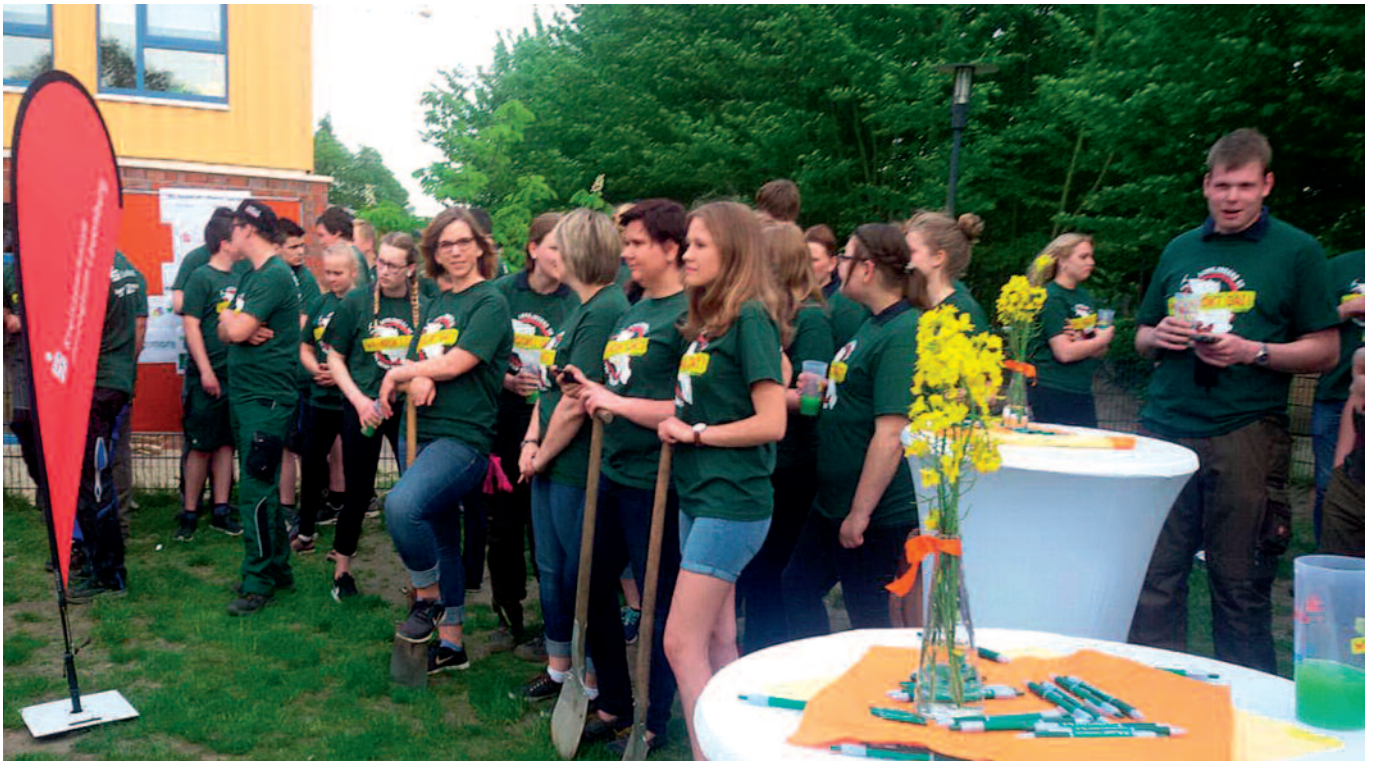
Die Berkenthiner Landjugend nahm an der bundesweiten 72-Stunden-Aktion unter dem Motto „Wi mookt dat!“ teil. Am 18. Mai warteten alle gespannt auf den „Startschuss“ und die Bekanntgabe der Aufgabe (o.), die es zu bewältigen galt: Einen Spielplatz bauen.