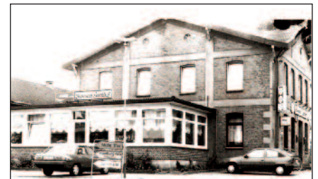
Im Jahr 1954 wurde an den Landgasthof eine markante Veranda angebaut, die auch heute noch existiert.