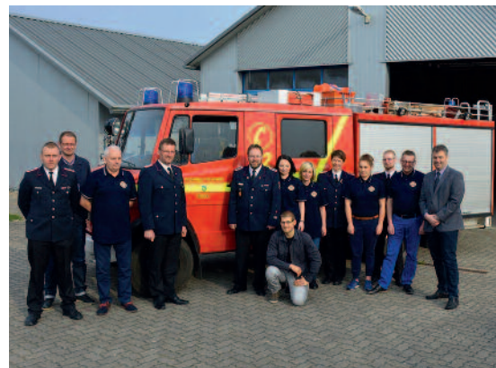
Gruppenfoto mit polnischen Feuerwehrkameraden. Die Gäste fühlten sich beim Vortreffen in Nusse herzlich aufgenommen.

Kurz nach dem Besuch in Polen ging das Planen bereits los. Und schon vier Wochen später fand in Nusse ein Vortreffen statt, zu dem neben dem Feuerwehrhauptmann vom Verband der Freiwilligen Feuerwehr Słupsk und den Vorsitzenden der Wehr aus Wlynkowo auch Betreuer anreisten, die die Jugendlichen im Sommer begleiten werden. Die polnische Delegation wollte sich einen Eindruck von der Umgebung und den Menschen machen, denen sie ihre Jugendlichen eine Sommerwoche lang anvertrauen. Sie besichtigten die Nusser Schule, in der die jungen Feuerwehrmänner und -frauen übernachteten, lernten bei einer Übung der Freiwilligen Feuerwehr Nusse die erwachsenen Kameraden kennen und konnten während eines gemeinsamen Grillabends miteinander fachsimpeln. „Die Atmosphäre stimmte auch bei diesem Treffen sofort“, freute sich