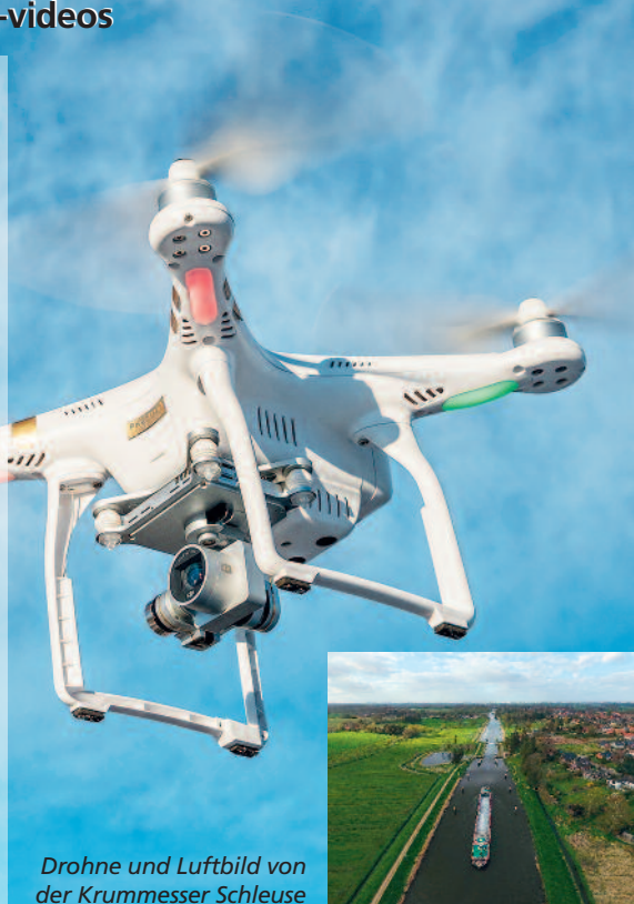
Drohne und Luftbild von der Krummesser Schleuse

Infos www.skyphotos.de , Tel. 0 45 01/7 77