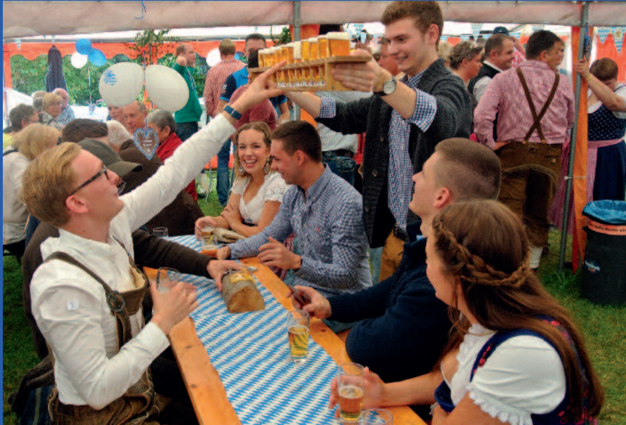
Sogar die jungen Leute kommen in hübschen Trachten zum Niendorfer Oktoberfest.

Am 25. September ab 11 Uhr heißt es auf dem Bolzplatz in Niendorf „O 'zapft is“. Die Feuerwehr freut sich über viele Besucher. Also: Auf zur Wies'n nach Niendorf! pg