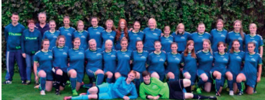
Gemeinsam stark: Fußballerinnen aus Berkenthin und Krummesse gründeten eine Spielgemeinschaft.