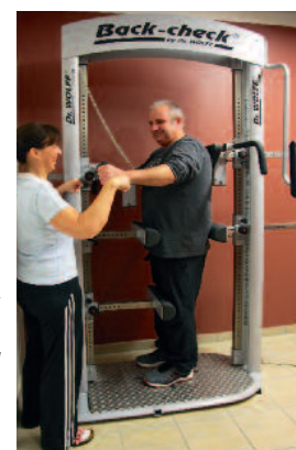
Vor dem zielgerichteten Training werden am „Back-Check-Gerät“ die Kräfte gemessen und somit die Problemzonen erkannt.

Infos: Gesundheitszentrum Berkenthin Von-Parkentin-Str. 55, 23919 Berkenthin, Tel. 0 45 44 / 8 90 87 90, Fax 80 87 21 info@gesundheitszentrum-berkenthin.de www.gesundheitszentrum-berkenthin.de