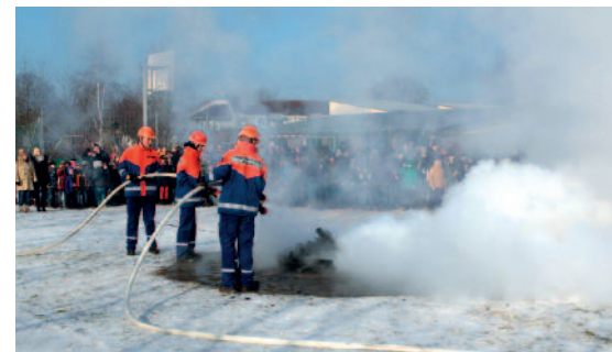
Für ihr Werbevideo zeigten die Mitglieder der Jugendfeuerwehr eine Kostprobe ihres Können.

Die Bewerbung beim „Hansa Park“ soll durch einen Video-Clip unterstrichen wer-