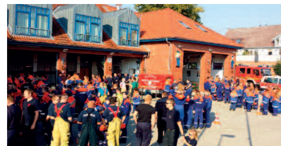
Mit einem Grillfest am Feuerwehrhaus feiert die Jugendfeuerwehr Krummesse am 27. Juni ihr 20jähriges Bestehen.