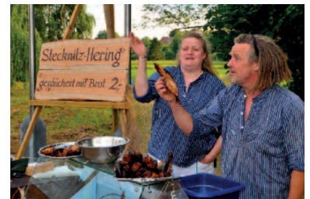
Frisch geräucherte Heringe, Seemannsgarn und Shantys gibt es bei „Käpt'n Tom“.