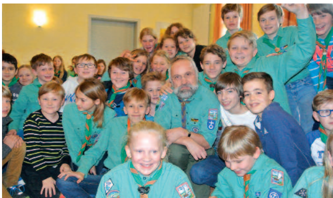
Die meisten Stecknitzpiraten kommen aus Krummesse, Klempau und Umgebung, einige wenige aus Lübeck.

Ev. Pfadfinder Krummesse für Kinder ab der zweiten Klasse, Gruppenstunde: freitags von 15.30 Uhr bis 17 Uhr im Sonnenhaus Krummesse, Ansprechpartner: Pastor Ulli Schwetasch, Tel. 0 45 08 / 4 00.