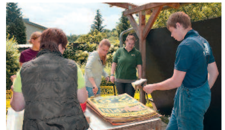
Mitglieder der Berkenthiner Landjugend bei den Vorbereitungen zum Scheunenfest.

Sieben Landjugenden gibt es im Kreis Herzogtum Lauenburg. Die Berkenthiner Landjugend ist mit knapp 100 Mitgliedern