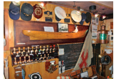
Exponate aus aller Welt beherbergt das kleine, private Museum in Krummesse.