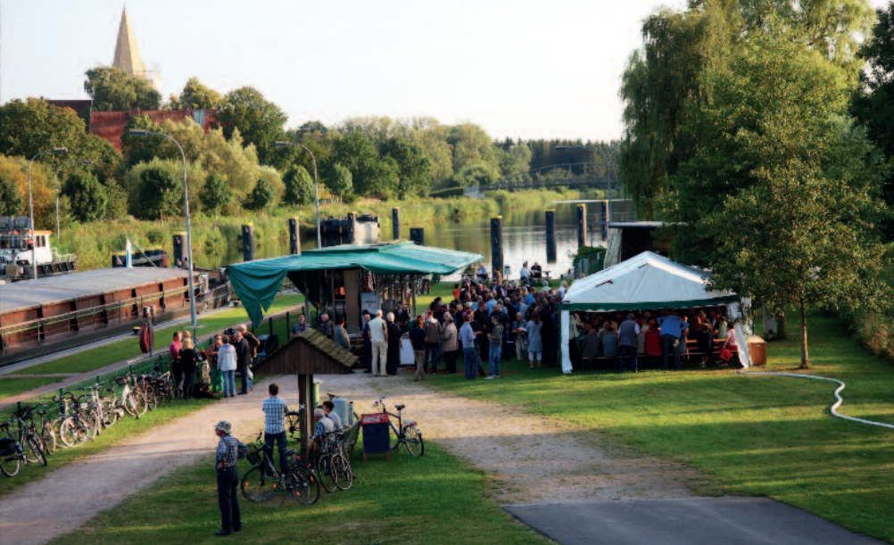
Das Festzelt gemütlich gefüllt, die mobile Brauerei fröhlich umlagert, so feierten rund 350 Bürger der Region ihr Stecknitz-Bier (l.). Die Stecknitz-Band aus Krummesse „servierte“ Oldies und aktuelle Hits am laufenden Band (u.).