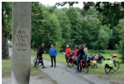
Die TeilnehmerInnen der ICT-Tour machen in Herrsburg Rast.

Infos: www.ironcurtaintrail.eu , www.adfc-mv.de und www.facebook.adfc-mv.de mb