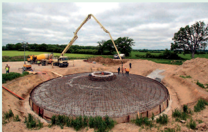
Vier Meter tief und bis zu 24,5 Meter breit sind die Löcher, in denen tonnenweise Eisen und 840 Kubikmeter Beton verbaut werden.

eingespeist. „Wir rechnen mit einem nicht so ganz kleinen Betrag an Gewerbesteuer, der ab etwa 2018 in die Gemeindekasse gespült wird“, machte Wiedenhöft deut-