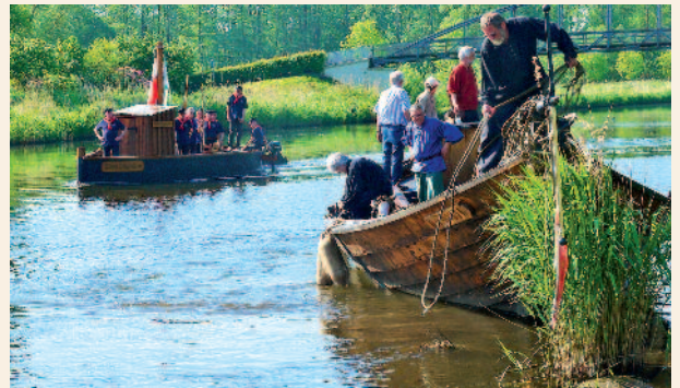
Am Sonntag vor den Hansetagen besuchten die Lüneburger mit ihrem Salz-Ewer die Berkenthiner Prahmkameraden.