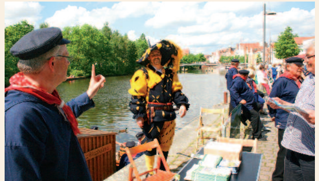
Der Stadtamthauptmann aus Lüneburg am Info-Stand der Berkenthiner Prahmkameraden.

an der Untertrave stattfand, machte die „Maria Magdalena“ an der Obertrave fest. Hier konnten die vielen interessierten Besucher die regionalen Spezialitäten verkosten, sich über die Region, die Stecknitzfahrt, das historische Transportschiff und die Entstehungsgeschichte der „Maria Magdalena“ informieren. pg