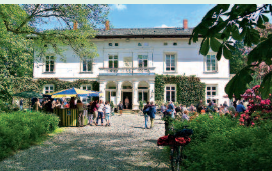
Das Hoffest auf Gut Bliestorf lockt alljährlich am 1. Mai viele Besucher an.

Infos: Gärtnerei Gut Bliestorf, Tel. 0 45 01 / 8 22 09 12, www.gaertnerei-gut-bliestorf.de