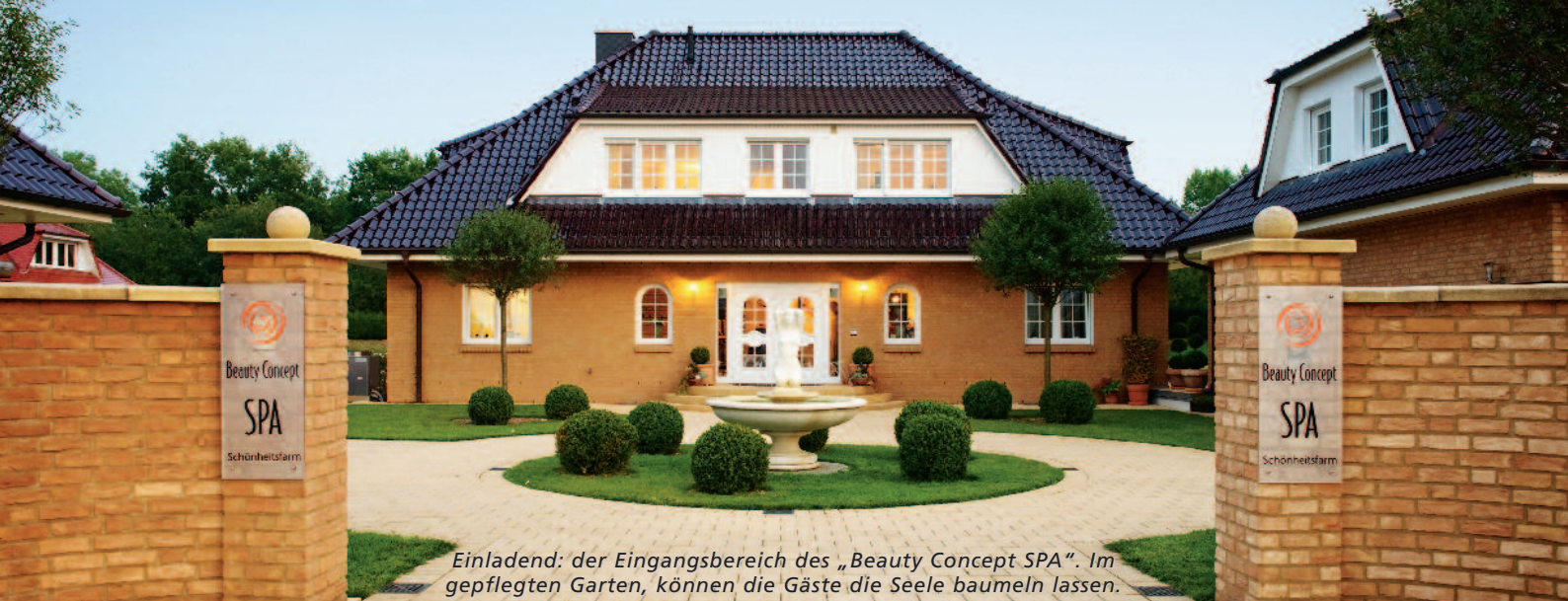
Einladend: der Eingangsbereich des „Beauty Concept SPA“. Im gepflegten Garten, können die Gäste die Seele baumeln lassen.