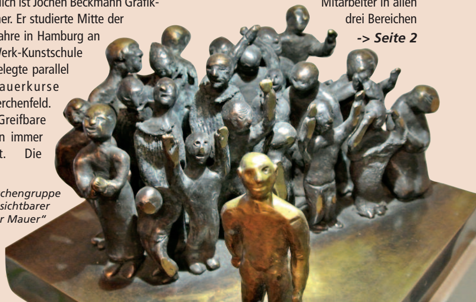
„Menschengruppe vor unsichtbarer innerer Mauer“