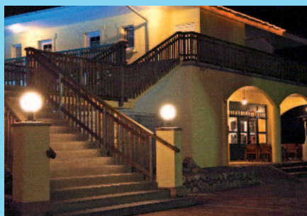
Das neue „Strandzentrum“ (unten) mit Innenpool (gr. Foto), gemütlichem Ruheraum im SPA-Bereich und Restaurant „Fienschmecker“ (v.l.n.r.).

Mit Rabatt und Nutzung der Wellnessabteilung für Leser der Stecknitz- Post.