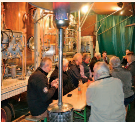
Vertreter des Tourismusbeirates haben in der mobilen Brauerei von Getränke Stapelfeldt in Mölln Biere verkostet.

Im Frühjahr soll die Idee den Bürgermeistern und den Gastronomen der Region vorgestellt werden. pg