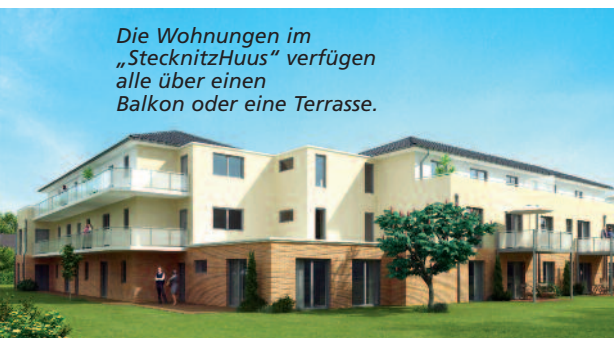
Die Wohnungen im „StecknitzHuus“ verfügen alle über einen Balkon oder eine Terrasse.