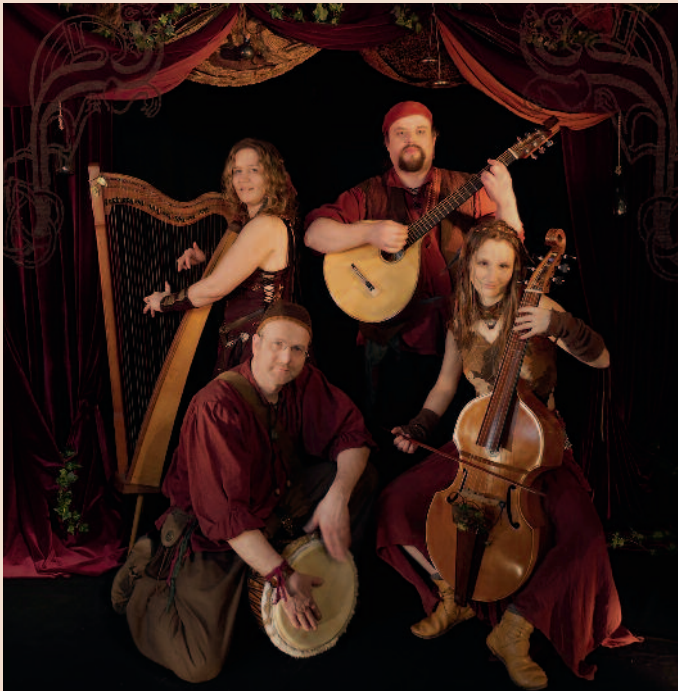
Die Mittelalter-Folk-Band „Schattenweber“ sorgt am 5. und 6. Juli 2014 auf der Festwiese zwischen Berkenthin und Göldenitz für Unterhaltung.