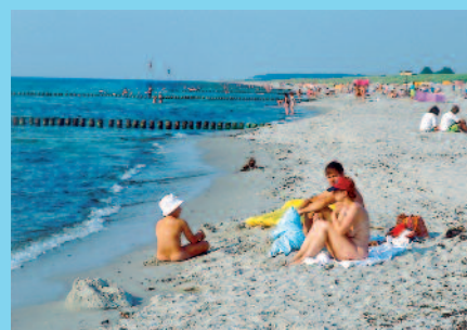
Der Camping- und Ferienpark mit umfangreichem Freizeitangebot, Wellness-Oase, Restaurants... liegt nur einen Steinwurf vom Ostseestrand entfernt.