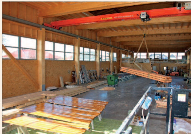
Die neue Halle hat eine Nutzfläche von 1.600 Quadratmetern auf drei Etagen, einen 5-Tonnen-Deckenkran und Montagetisch.