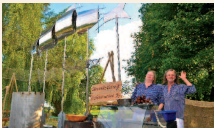
Das Siegerfoto vom 1. Fotowettbewerb nahm Mathu Seichter aus Bokel beim Stecknitzfest 2013 in Berkenthin auf.

Stecken Sie die Kamera ein, halten Sie die schönsten Momente fest, und nehmen Sie am Fotowettbewerb teil! Veranstalter des Fotowettbewerbs ist wieder das Amt Berkenthin, Am Schart 16, 23919 Berkenthin.