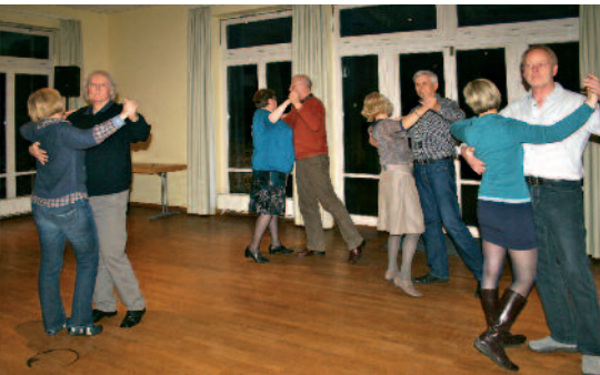
Im Kreise Gleichgesinnter jeden Alters Spaß haben und Tanzen lernen

Nicht jedem ist es von Natur aus gegeben, sich auf dem Parkett sicher zu bewegen. Wem zur schönsten Musik und zu den unterschiedlichsten Rhythmen immer nur dieselben Schritte zur Verfügung stehen, verliert schnell die Lust am Tanzen.