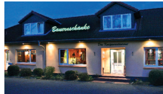
Von der Kneipe mit kleiner Speisekarte entwickelte sich „Oldehaver's Bauernschänke“ zu einem beliebten Restaurant.

Silvester ist das Restaurant geöffnet. Im letzten Jahr hatten Oldehavers die Idee, am Silvesterabend ein „Buffet quer durch die Küche“ anzubieten. Das war ein voller Erfolg und wird deshalb in diesem Jahr wiederholt. Die Oldehavers freuen sich schon: „Da rockt die Küche!“